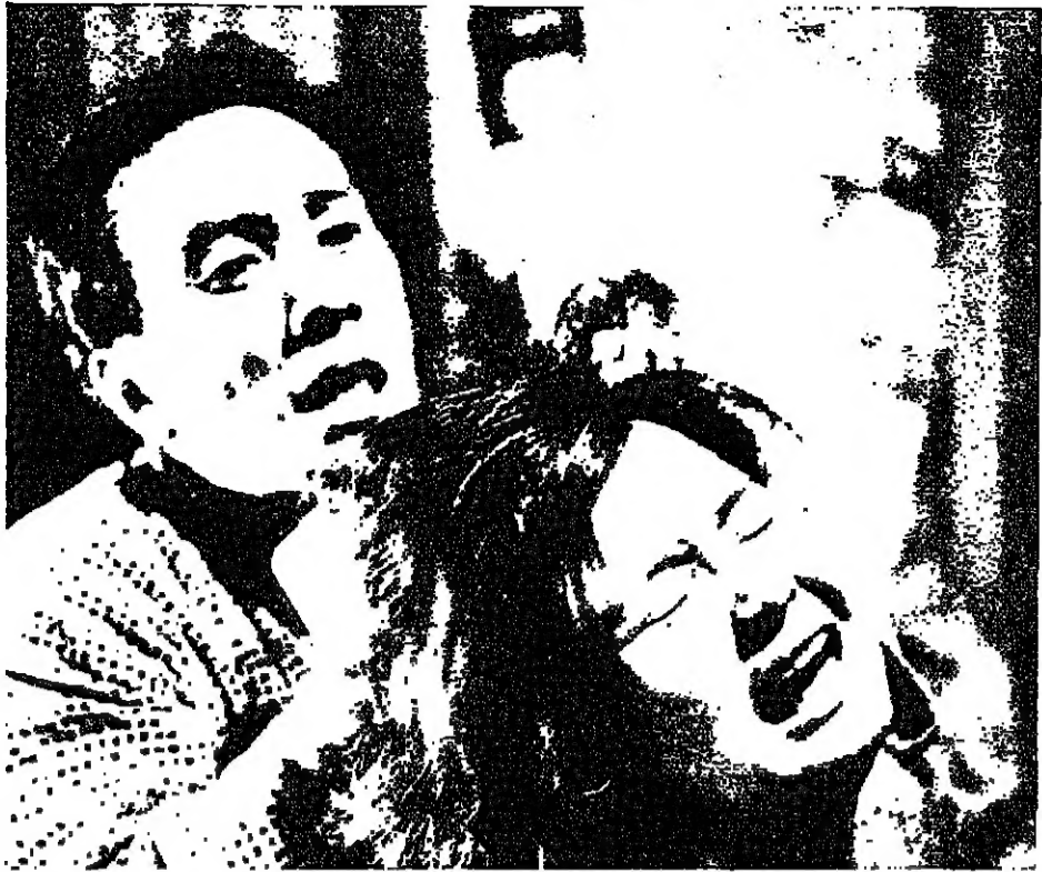
الزوج والزوجة - علاقة غريبة